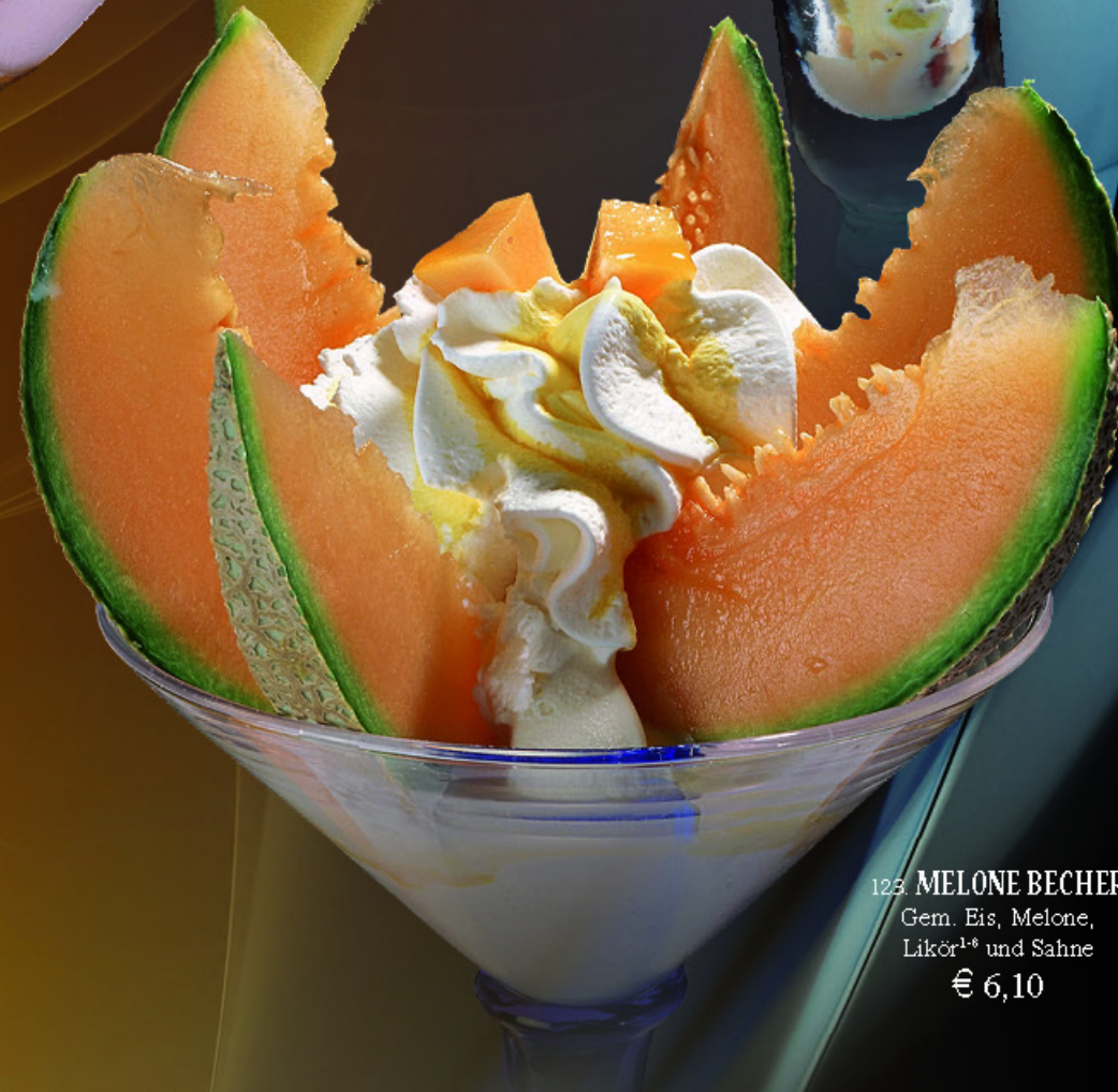
123. MELONE BECHER Gem. Eis, Melone, Likör¹² und Sahne € 6,10