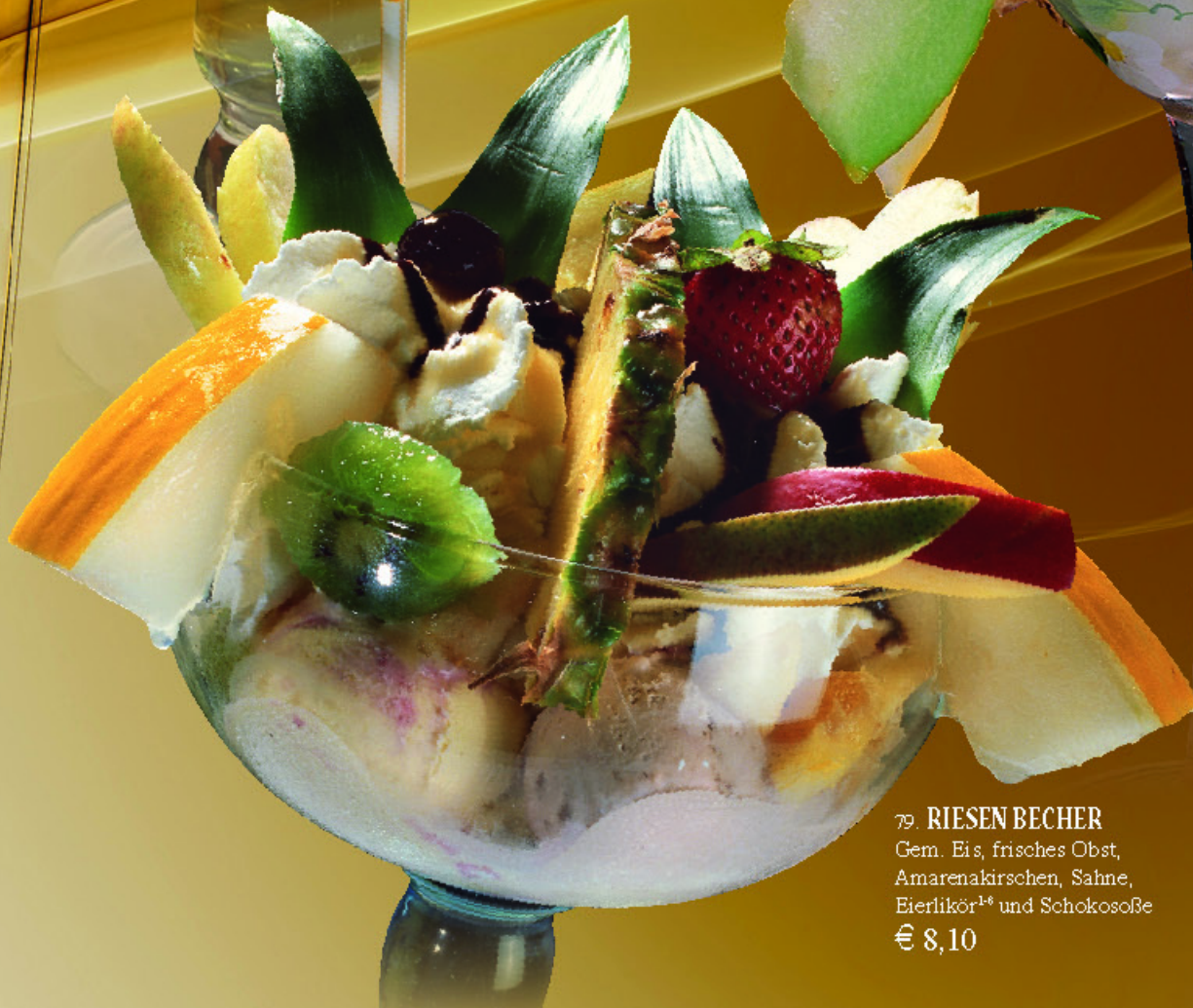
79. RIESEN BECHER Gem. Eis, frisches Obst, Amarenakirschen, Sahne, Eierlikör¹² und Schokosoße € 8,10