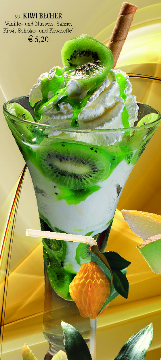
99. KIWI BECHER Vanille- und Nusseis, Sahne, Kiwi, Schoko- und Kiwisoße¹ € 5,20