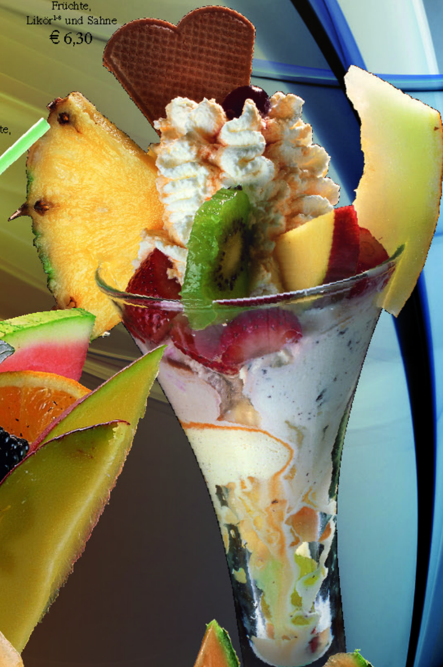
86. SANDOKAN BECHER Gem. Eis, frische Früchte, Likör¹² und Sahne € 6,30