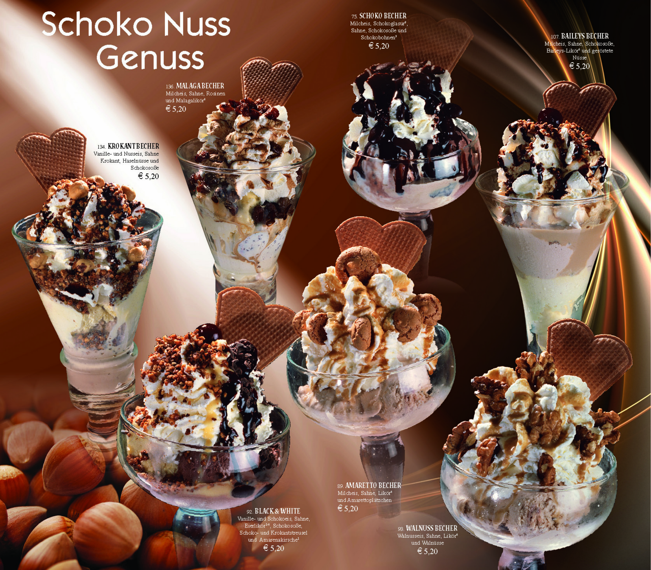
93. WALNUSS BECHER Walnusseis, Sahne, Likör® und Walnüsse € 5,20